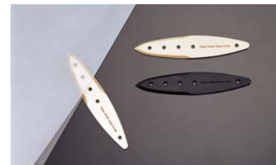
NICO 百年物語「ペーパーナイフ」