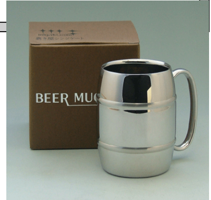
磨き屋シンジケート「ビアマグカップ」