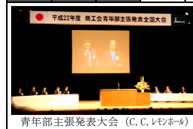
青年部主張発表大会 (C.C.レモンホール)