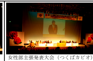
女性部主張発表大会 (つくばカピオ)

25日、青年部、女性部の全国大会がそれぞれ開催され、翌26日は、日本武道館で「商工会法施行50周年記念式典」がありました。