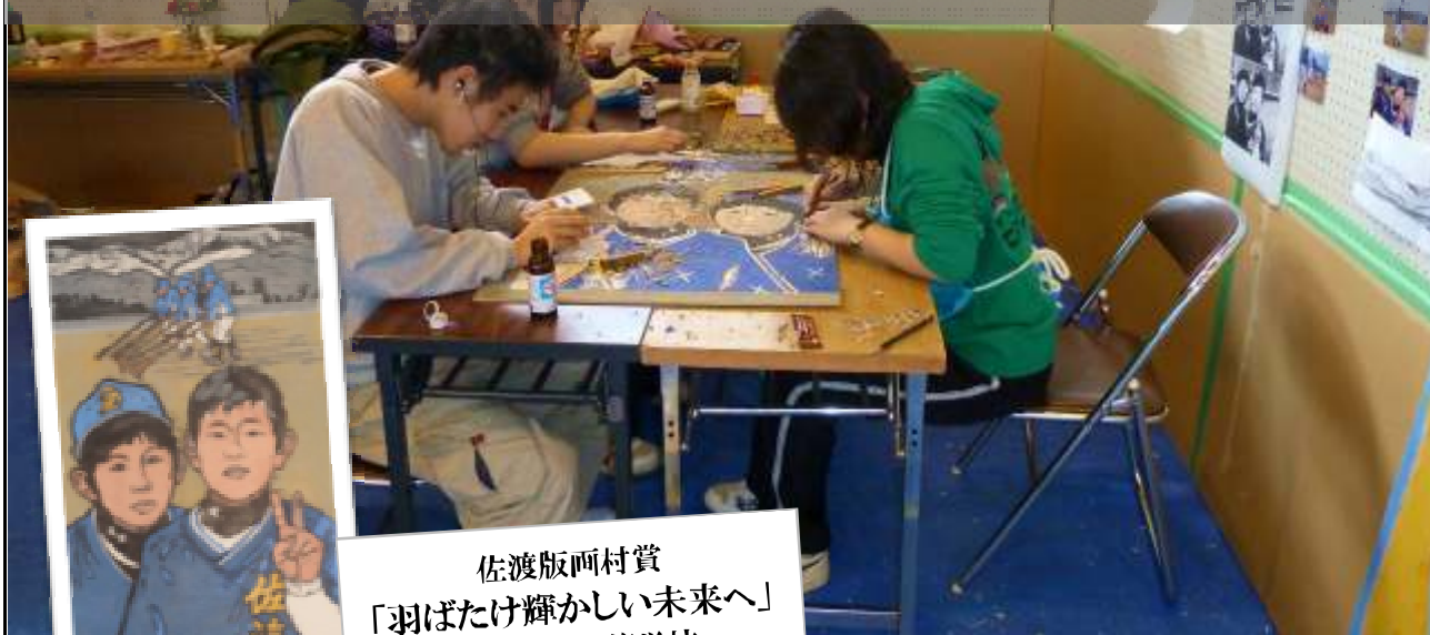
佐渡版画村賞 「羽ばたけ輝かしい未来へ」 千葉黎明高等学校